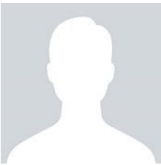
Chi San Wong 黃梓新 (Juni 2022 afgetreden)